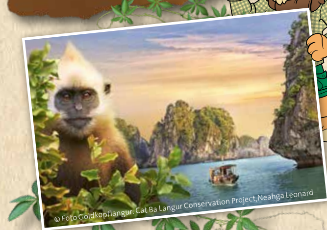
© Foto Goldkopflangur, Cat Ba Langur Conservation Project, Neahga Leonard